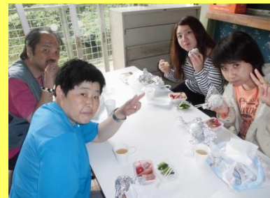
腹ごしらえ「おいしい！」

おにぎりは、自分で握ったよ。みんな2個、3個握ったよ。やっぱり雨が降って残念！ 誰か雨男がいたのかな？ しばらくすると雨が止みました。パターゴルフをやったよ。