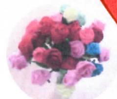
フェルト製のバラ

発行：岩屋病院デイケア「ひだまり」 〒440-0842 豊橋市岩屋町字岩屋下 39 の 1 ☎0532-61-6239