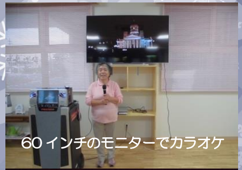
60インチのモニターでカラオケ