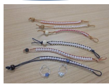
女子会らしく、可愛らしいプレスレット★ 可愛らしく出来ました♪