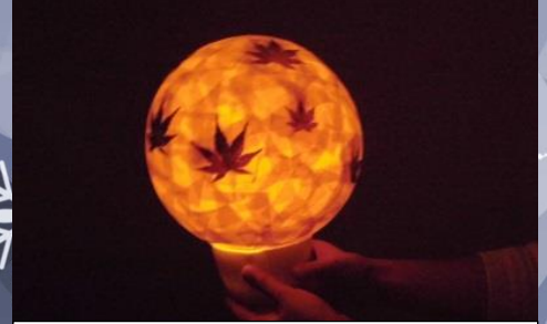
和紙のランプ@おざクラ