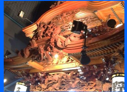
御殿屋台の龍 1本彫り