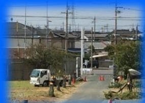
工事の為桜を切ってます