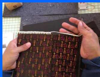
紐を通して最中(サイフ)