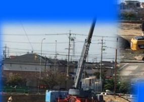
重機が入り工事の始まり