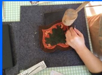
穴あけとる最中(眼鏡入れ)