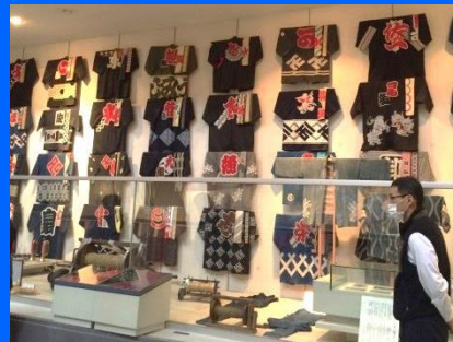
はっぴ 法被の展示