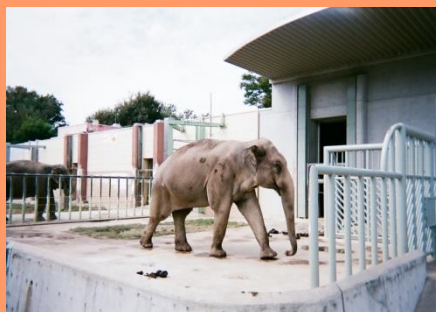
ゾウだけに大きかったゾウ