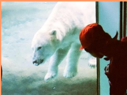
白クマのダイビング