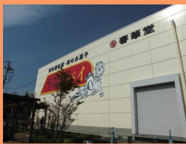
うなぎパイ工場だ