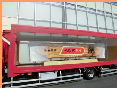
巨大うなぎパイの写真