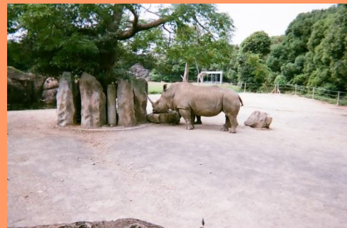
大きなサイだった