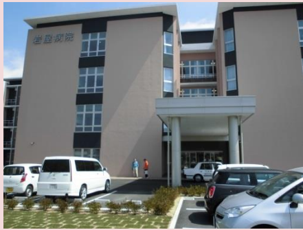
新岩屋病院の全景