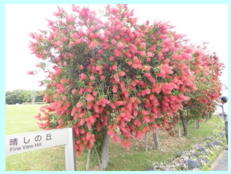
和名：ブラシノキ 学名：コリステモン スペキオスス

5月25日(水)に希望者11名で浜名湖ガーデンパークへ行きました。ガーデンパーク内はきれいになっていて、美しいバラ等がいっぱい咲いていました。昼食はガーデンパーク内の食堂で食べました。350円でソフトクリームを食べた人もいます。