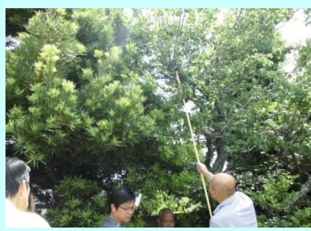
梅を採っています