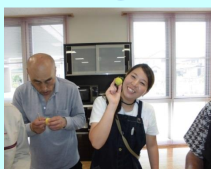
梅デース！ by 内田です！