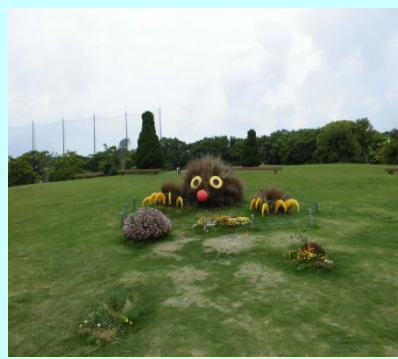
モグラがでてくるぞ！