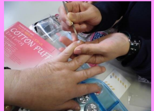
ネイルアート実行中

「いつもきれいでいたい。」 女性の願いをこめたプログラムが、「女性のためのメイク」です。 今回はネイルとしました。マニキュアも豊富、飾りのシールもついたり、 新しい発見ができました。 実際やってみると、きれいに出来上がりました。 皆さんも参加してみたいはいかがですか？楽しく美しくなりましょう。