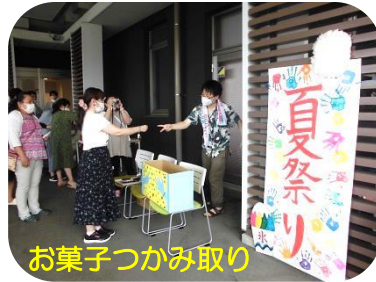
お菓子つかみ取り