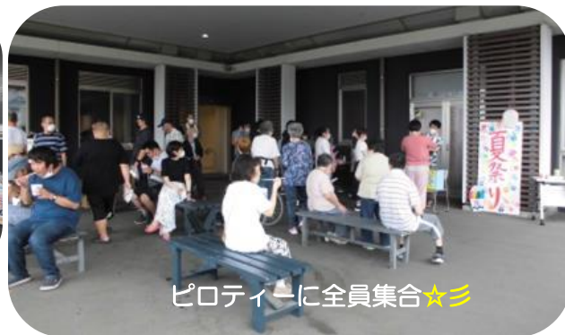
ピロティーに全員集合☆